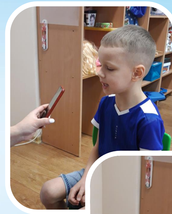
Актёры озвучили мультфильм